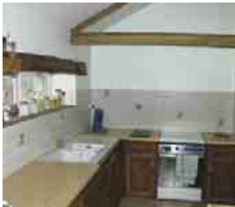
EXEMPLE DE RÉHABILITATION

Contact : Xavier Daguin au 02 48 48 58 94 ou par mail opah.bourges@agglo-bourgesplus.fr