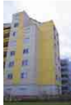
QUARTIER DU VAL D'AURON ACTUELLEMENT À L'ÉTUDE

L'OHF a également des missions d'information auprès du public. A moyen terme, il deviendra un lieu-ressource en matière d'habitat, de foncier, de démographie pour les 14 communes de l'agglomération, les partenaires locaux et le "grand public". A ce titre, début 2008, le particulier pourra accéder aux productions 2007 de l'Observatoire, via le site Web. Pour accéder à des