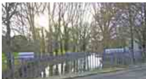
TRAVERSÉE DE L'AIRIN À SAVIGNY-EN-SEPTAINE