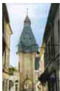
PORTE DE MEHUN-SUR-YÈVRE

sur chaque partie de son territoire. C'est donc un véritable outil intercommunal de planification de différentes politiques publiques. Il fixe par exemple les orientations générales de l'aménagement de l'espace tout en veillant à un maintien