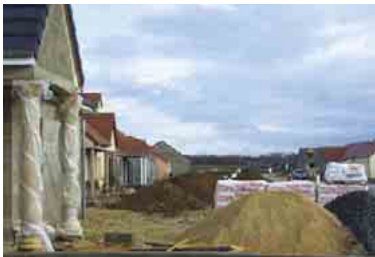
NOUVEAU LOTISSEMENT À FUSSY