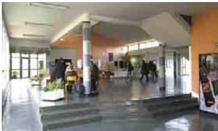
HALL D'ACCUEIL DE LA FACULTÉ DES SCIENCES

l'offre de soins, ou la revitalisation des centres villes. Crédits d'études d'un montant de