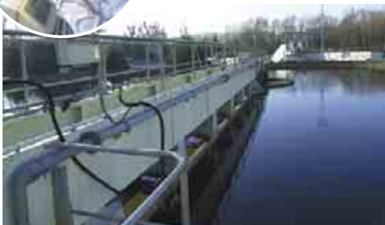
LA STATION VUE D'UN CLARIFICATEUR