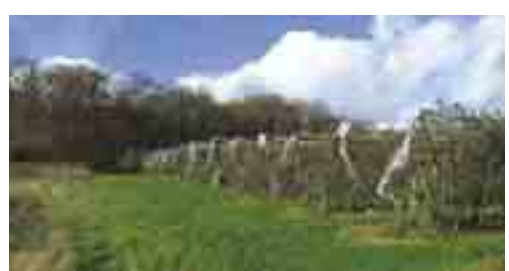
POMMIERS EN LISIÈRE DE LA FORÊT D'ALLOGNY