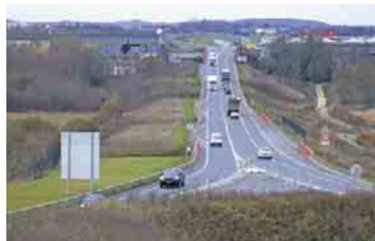
ROCADE EST - PORTE DE NEVERS

encore démographiques. C'est d'ailleurs l'objet de la seconde phase du processus. C'est-à-dire que le SIRDAB, une fois le rapport d'expertise réalisé, va lancer l'élaboration d'un document définissant une stratégie d'actions dans un souci de pérennité dans le temps : le Projet d'Aménagement et de