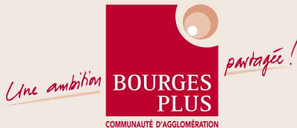
Serge Lepeltier Ancien Ministre Président de Bourges Plus Maire de Bourges