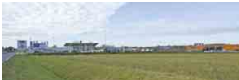
ZONE D'ACTIVITÉS À SAINT-FLORENT-SUR-CHER