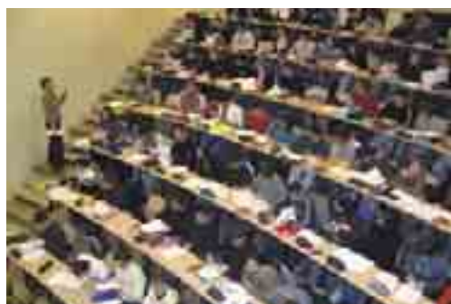
AMPHITHÉÂTRE DE L'ENSI

des pistes seront examinées en priorité autour notamment de la Conférence Annuelle de l'Enseignement Supérieur et des besoins en formation des entreprises du territoire qu'il conviendra d'associer étroitement à la démarche. ■